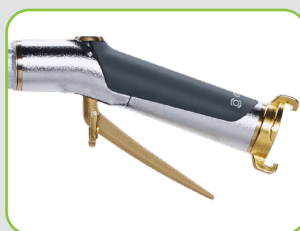
Valve à levier pour un travail confortable et un dosage subtil