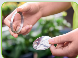
Remplacement et nettoyage faciles de la platine