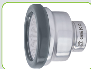
Bague de protection en caoutchouc pour éviter tous dommages