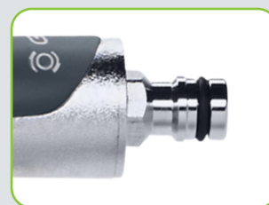
3060GGSSB : avec raccord enfichable GEKA® plus