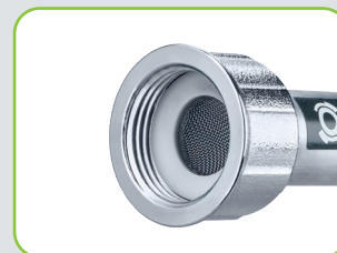
Filtre à impuretés inséré empêchant la formation de dépôts

Vous pouvez trouver produits sur carte dans le chapitre 4 Système de raccords